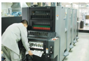
ドイツ・ハイデルベルグ社の機械

例えば、最近アニカラーを導入し、より高品質な仕上がりを提供している。「いくらい設備を入れても、使う人の技術が未熟ではない仕上がりに必要ありません。弊社では、インクを練る技術もマスターしています」。特色や金銀、蛍光、ニス引き、広色域印刷等、多彩な印刷が可能です。