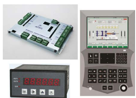
自社製品のコントローラなど