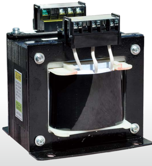
安全に電気を使用する各種トランスを供給する