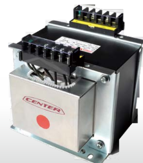
電源ノイズ・制御回路ノイズ対策トランス