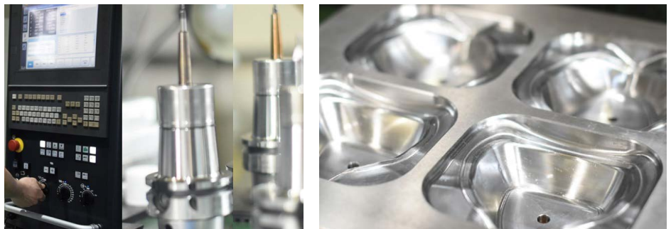
設計・モデリングから手厚く支援する

同社は、利他(動機善なりや、私心 なかりしか)感謝「挑戦」を掲げる。こ の社是のもと、丸一工業は顧客のもの づくりを支える金型設計・製作を追求 し続ける。