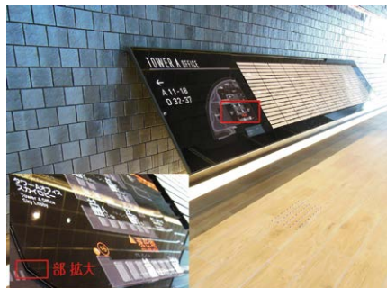
ビルの総合案内サインと点字部分