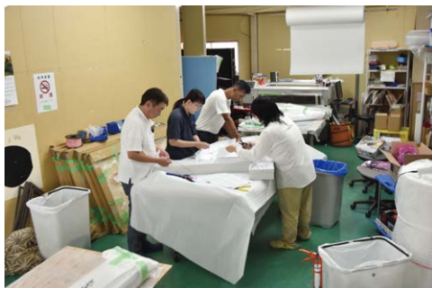
自社工場での製作の様子

立地や地域性などを踏まえ、建築物や自然環境に配慮したデザインや形状を取り入れることは、看板やサインづくりで重要となる。そこで、環境経営システム「エコアクション21」の認証を取得し、企業活動でも環境に配慮した取り組みを始めている。木材やプラスチック、金属などの廃棄物は分別し、アクリル樹脂やポリエチレン樹脂は地域のリサイクル工場に引き取ってもらっている。また、令和5年にはソーラーパネルと蓄電池により24時間稼働のソーラーサイネージ(表示装置)を開発した。避難者などの誘導看板としての活用が期待され、自治体や公共施設向けに広くアピールしていく。