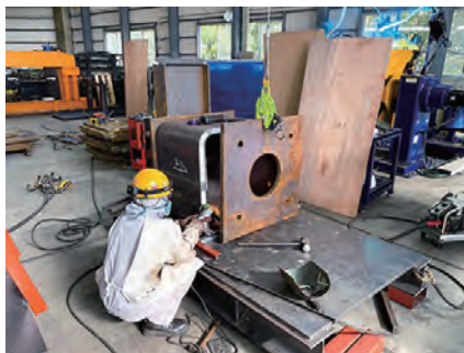
鋼管加工も手がけることで信頼を得ている