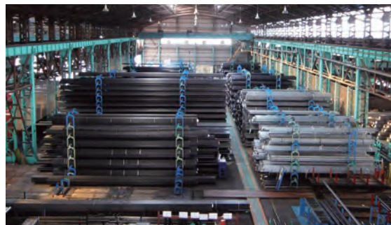
適切な鋼管の在庫管理で即納に対応する