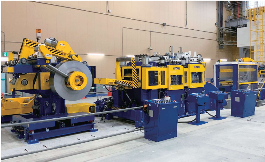
主力商品ブランキングプレス用コイルライン