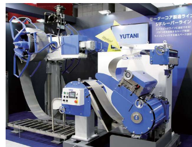
開発機種を展示会で発表