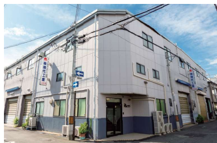
現代工業の本社全景