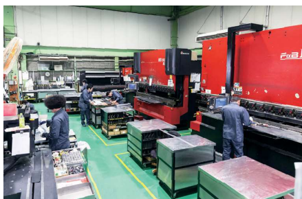
大阪市生野区の本社工場内