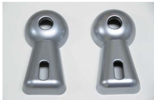
塗装レス製品(左)と塗装製品