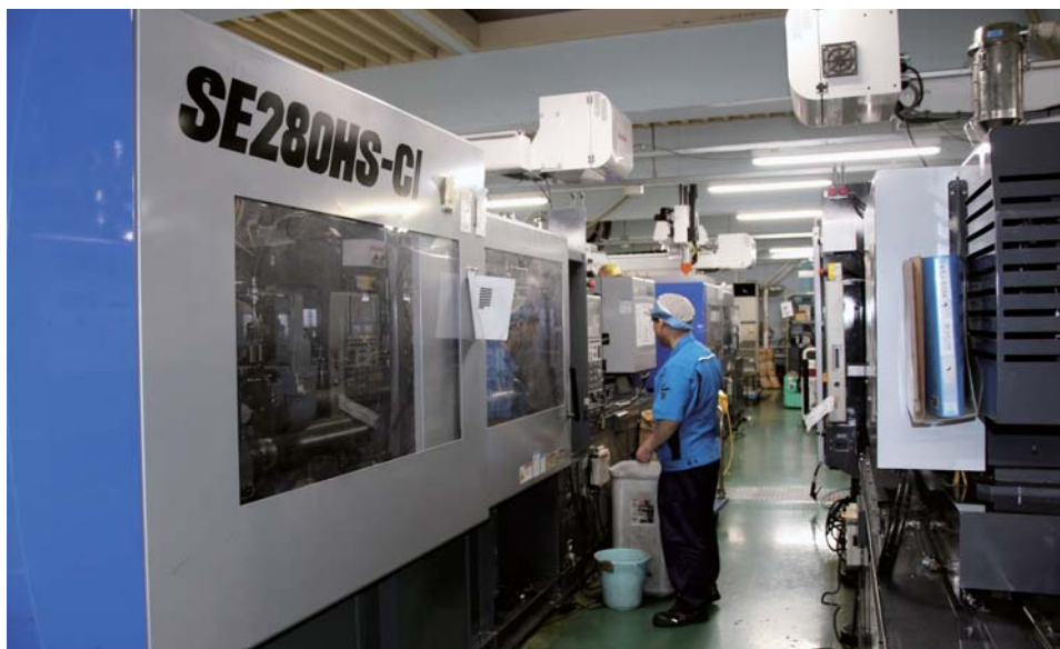
2色成形が可能な電動射出成形機