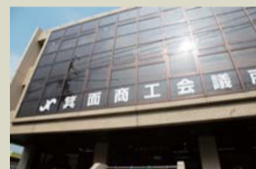
箕面商工会議所 中小企業相談所

トーリーを考えていく中で、事業者の強みを引き出し、次のステップに繋がる発想で、事業主と一緒に作り上げていく。また、今回で第3回を迎え、看板事業となりつつある街のゼミナール「みのおのまち商学校」では、事業者がお客様との新たな関係性を作る場として機能し始めている。今後も、一人でも多くの人に「うちも頑張ろう！」と思っただけのよう、必要とされる会議所を目指して、経営指導員全員で全力でのサポートを誓う。