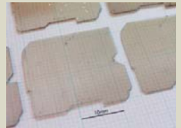
関西センターで開発した世界最大級のダイヤモンド単結晶ウエハ(薄板)。新しいパワーデバイスなどへの需要が見込まれている。