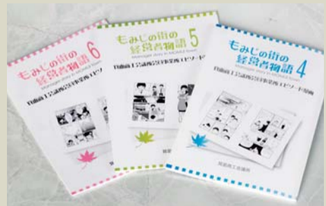
会員事業者のエピソード漫画「もみじの街の経営者物語」