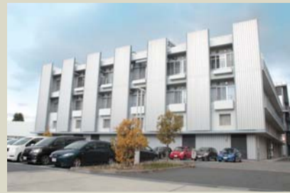
「技術研究組合リチウム電池材料評価研究センター」(蓄電池研究の企業約20社)が入る関西産学官連携研究棟