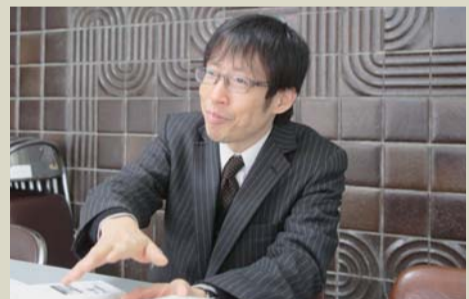
熱意を持って事業者のサポートに取り組む秋田所長