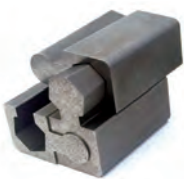
上下異形状 嵌め合い加工を 得意とする

同時に、ワイヤ放電加工において、材料特性や形状、機械の癖を熟知した技術者の存在が不可欠だ。社員にはワイヤ放電加工技能士の取得を奨励しており、資格を保有する社員らとともにさらに技術に磨きをかけていく。