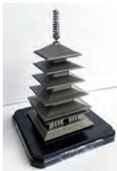
加工した五重塔は 技術力の結晶