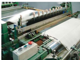
工場内に織機30台を保有

また、金網と金属不織布を組み合わせた複合フィルターを製造できるのも特長。国際的な衣料ブランドの機能性衣類の製造現場に使われる等、異物等の混入が許されない特殊分野