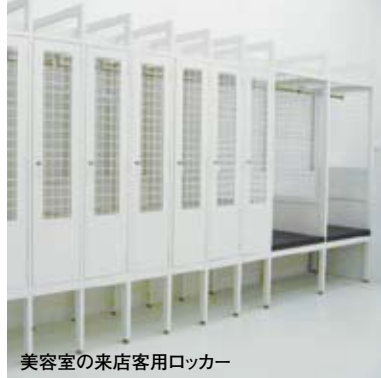
美容室の来店客用ロッカー