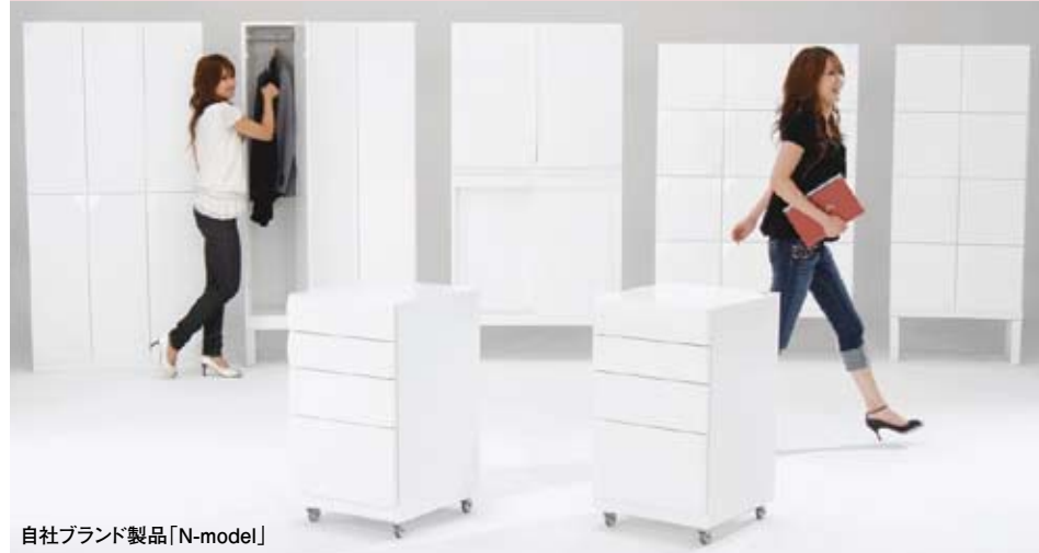
自社ブランド製品「N-model」

理化学・医療機器商社、官公庁及び日本郵政、建築関連会社、ホテル・飲食業、産業機械会社等